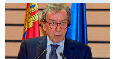
SOMOS CASTILLA Y LEÓN

BURGOS El alcalde, que tiene entre sus competencias decidir el orden de debate de los asuntos en el Pleno, ha dejado fuera del orden del día una proposición conjunta de los tres grupos de la oposición en el Ayuntamiento (PSOE, Imagina y Ciudadanos) para reprobación su conducta, entre otras cuestiones, por el reiterado incumplimiento de la mayoría de los acuerdos plenarios de este mandato. PÁG. 5