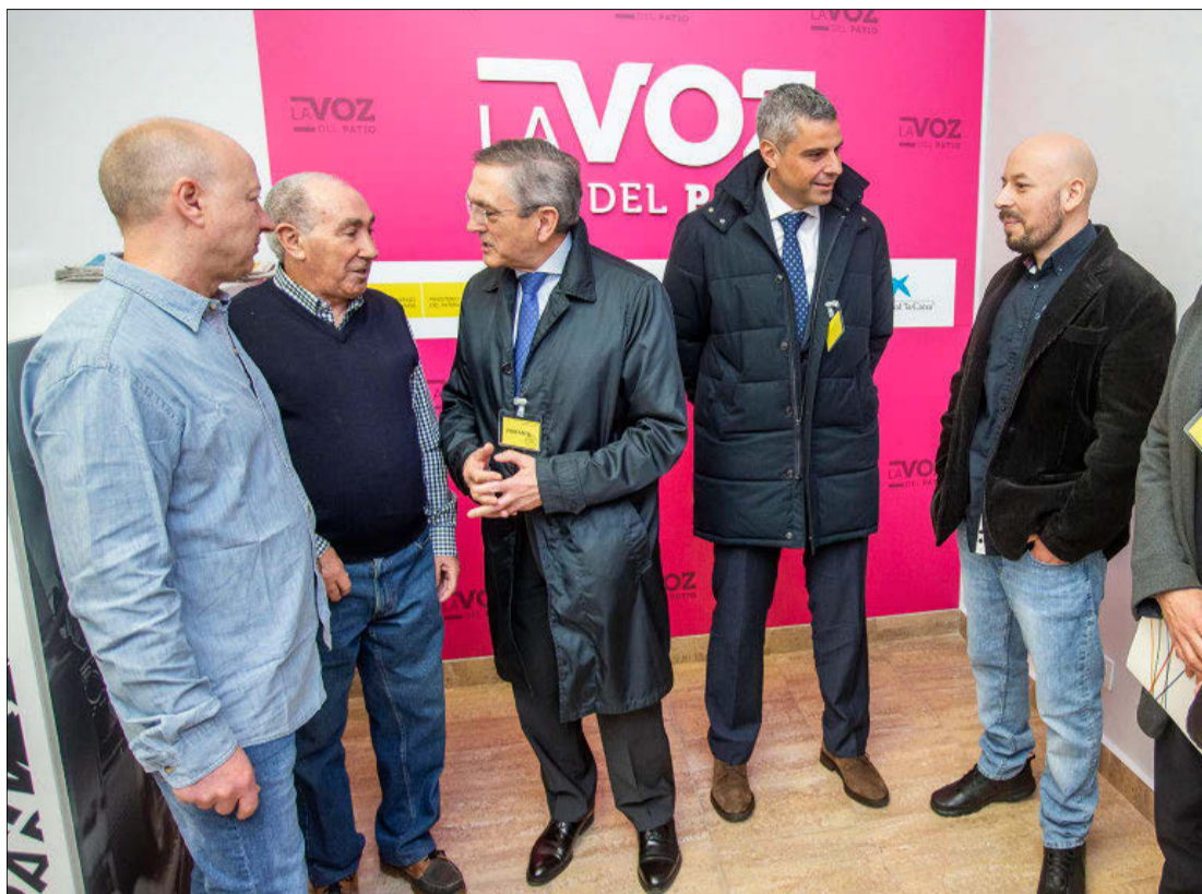
Presos participantes en el proyecto conversan con miembros de las entidades colaboradoras.