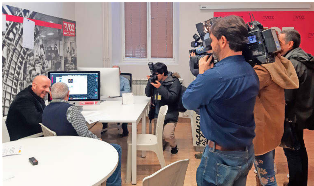
Periodistas burgaleses graban y fotografían a los 'aprendices' del oficio.